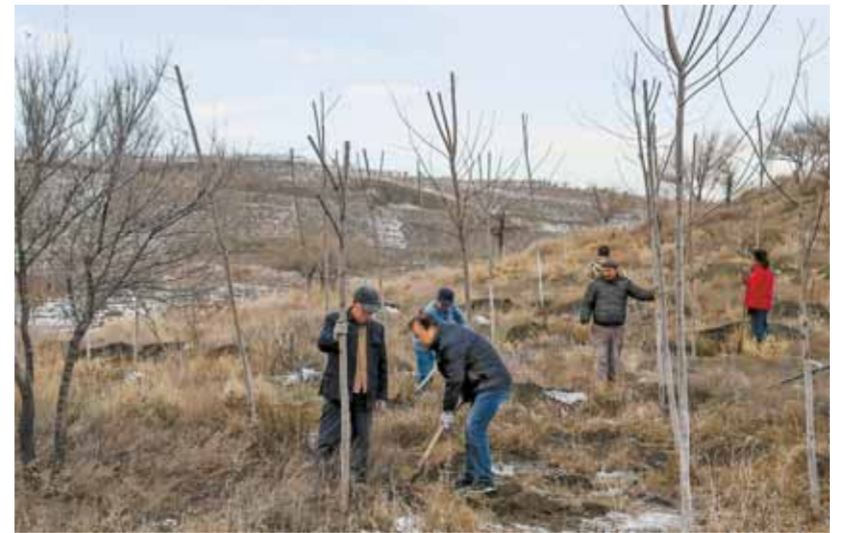
11 - ئايدىكى 15 - كۈنى ان لىشىڭ (سولدان 2 -) مەن كاسپىيەستەرى ۋىرەنۈ قالاسىنىڭ يامالىق تاۋىدا اعاش ەگۋدە . □ سۇرەتنى تىلشىمىز شىبە لۇڭ تۇسرىگەن

شارۋاشلىقى جانە جايلىم مەكەمەسى ەكولوگىيەنى قورغاۋ، قالىپنا كەلتىرۋ باسقارماسىنىڭ ورنىباسار باسستى ياك جىيانىڭ . يامالىق تاۋى ۋىرەنۈ قالا - سىنىڭ جوعارى جەل وتسە ورننا -